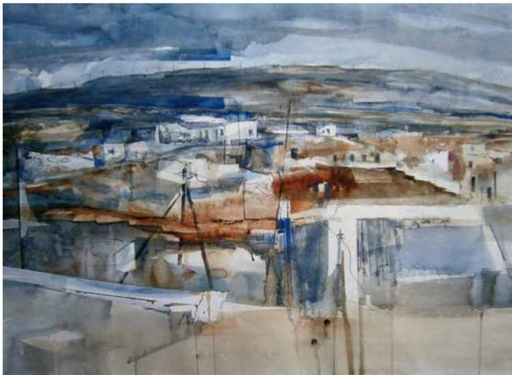
UN LUGAR DE CAUDETE