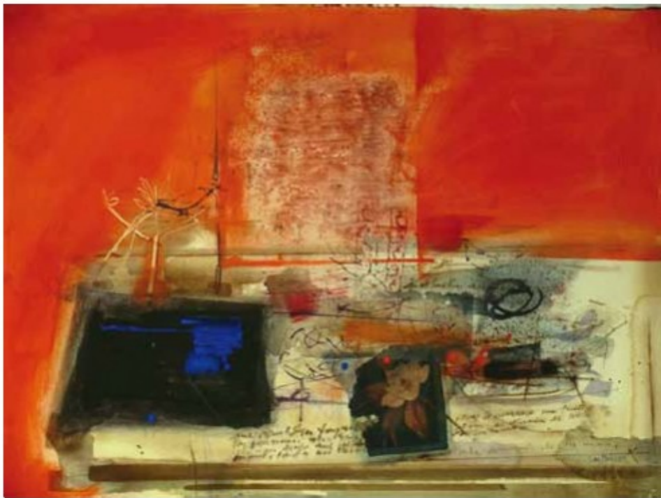
RECUERDOS DEL PASADO