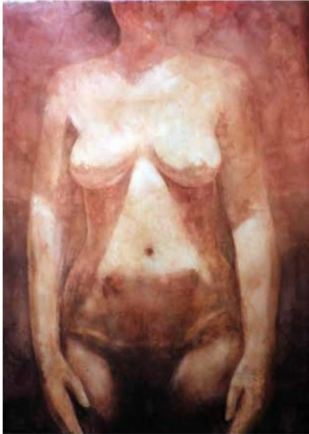
LA VENUS DE ALCAÉN

José Antonio García Villarrubla - Toledo