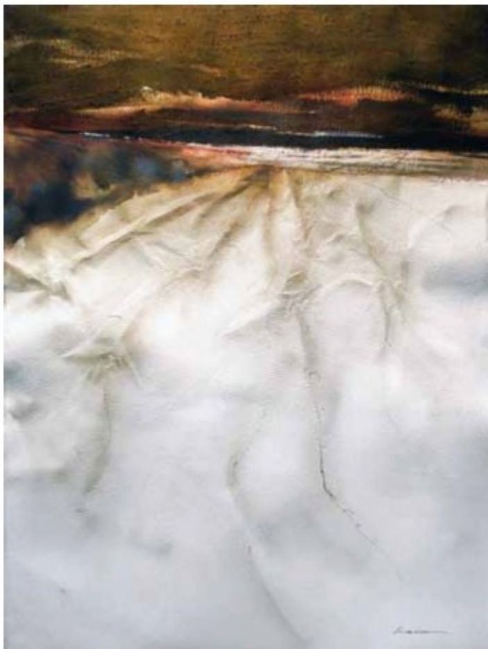
ANOCECE EN LOS MONEGROS