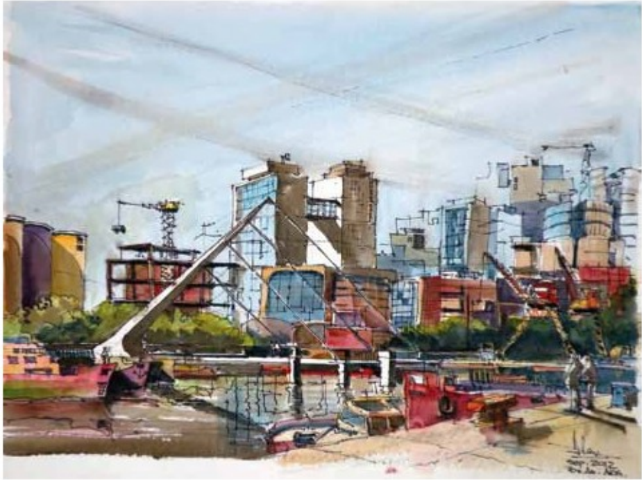
PUENTE DE LA MUJER