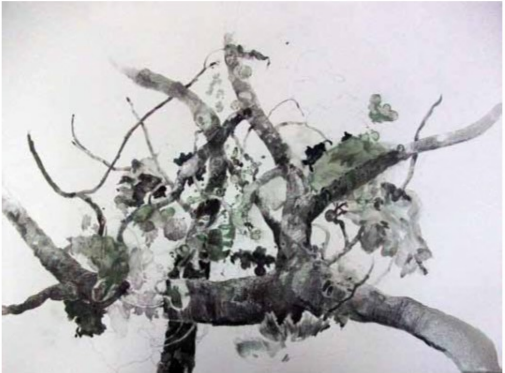
LA HIGUERA DE IKER