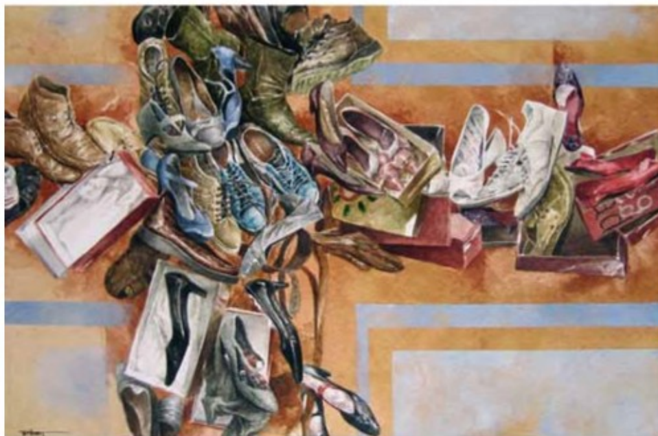
"EL GUANTE DE LA UTOPIÍA" Homenaje a Eduardo Galeano. Cristóbal Garrido Leal - La Orotava