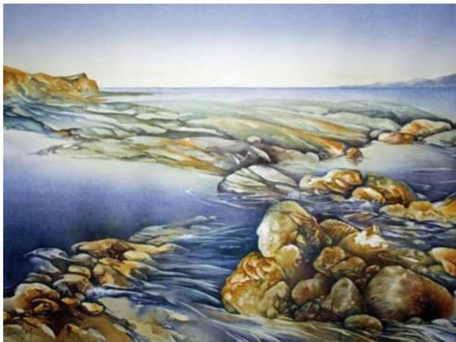
ENTRE TERRE ET MER (Between Land and Sea)