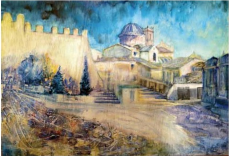
CAUDETE EN EL RECUERDO