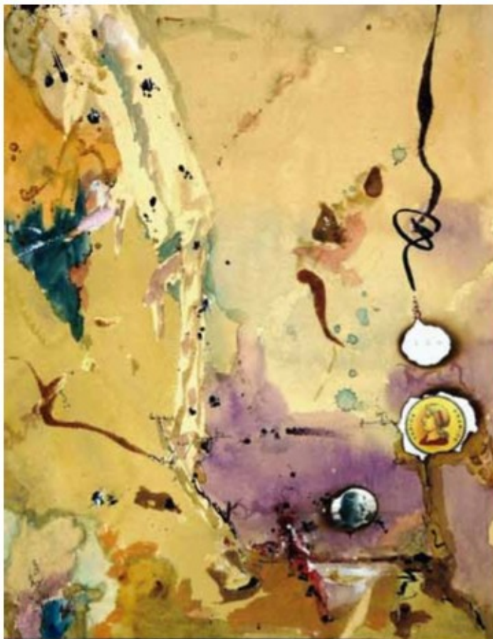
VAN PASANDO POCO A POCO