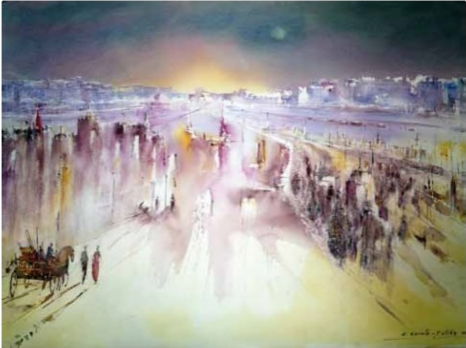
CAMBIOS AL CAER LA TARDE