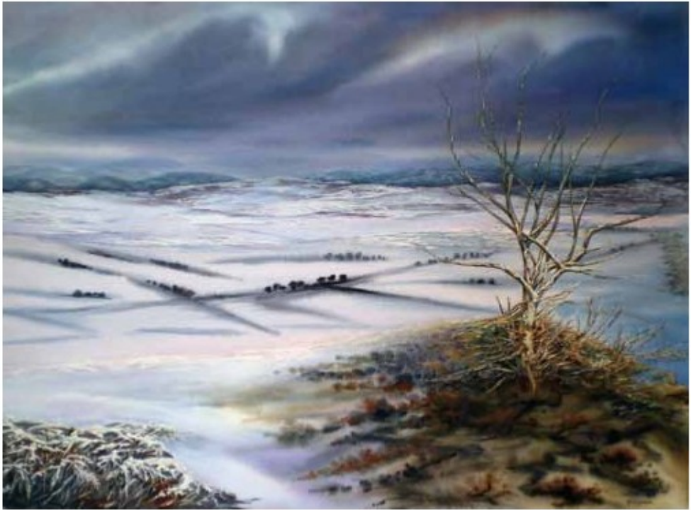
INVIERNO EN EL LLANO